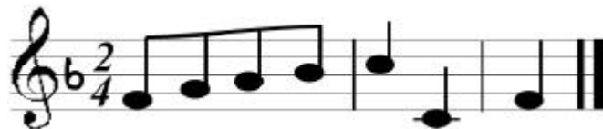
Nå hår wi fårtjænt en dram